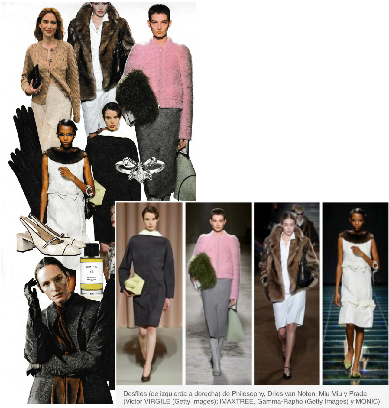
Desfiles (de izquierda a derecha) de Philosophy, Dries van Noten, Miu Miu y Prada