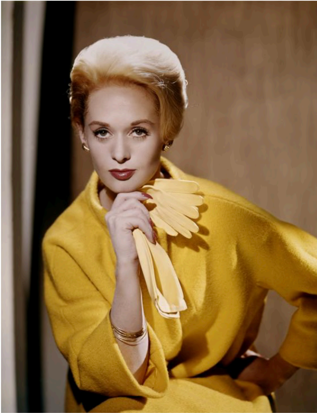
Tippi Hedren, una de las musas de Alfred Hitchcock y vestida con uno de los colores en tendencia de esta temporada

Hablamos de vestidos de tirantes en negro o con estampados florales, pero también de prendas sobrias, incluso minimalistas, que nos recuerdan al llamado lujo silencioso. “La clave en los looks monocromo está en los detalles, como una gargantilla de perlas, un broche de brillantes o un cinturón delgado con hebilla dorada. También podemos recurrir a los bolsos, tanto de mano como cruzados en cadena, a los guantes o a un sombrero cloché , redondo y de ala estrecha”, expone Monica Logo, estilista y docente en el Istituto Marangoni de Milán.