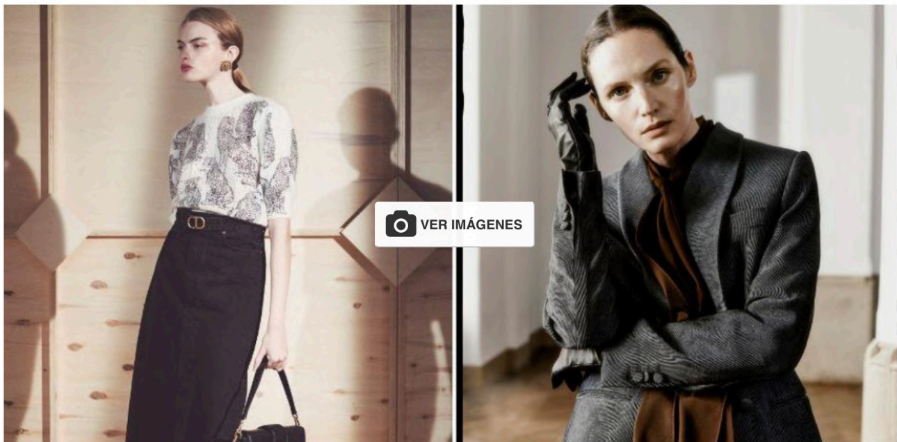
Lady like (Twinset y Brioni)