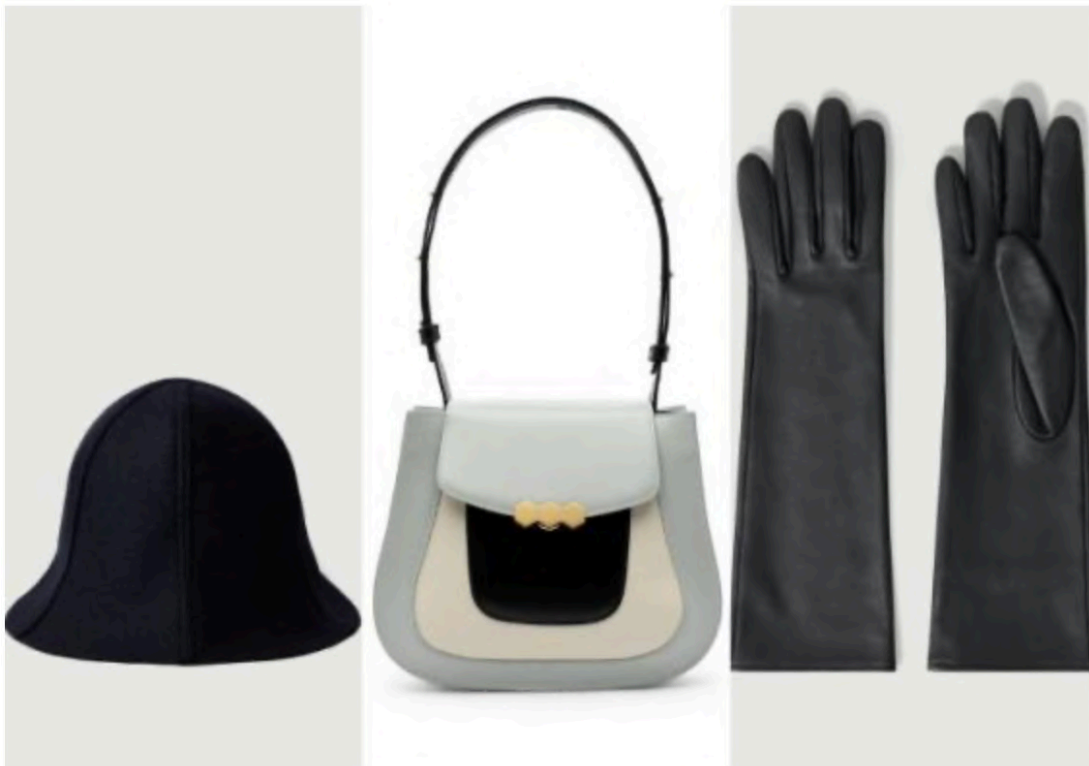
Los complementos 'ladylike' también son muy chic. El bolso es de Mietis y el sombrero y los guantes son de Soeur (Mietis y Soeur)

Esta vuelta a los cincuenta ha llegado incluso a la perfumería, con fragancias como Chypre 21 de Heeley, inspirada en las divas de esa década y con notas de rosa, bergamota y patchouli. En el terreno del interiorismo regresan las líneas limpias y geométricas del estilo midcentury, con figuras prominentes como los Eames y los escandinavos Eero Saarinen y Arne Jacobsen.